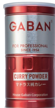
GABAN® マドラス純カレー

スパイスの種類を絞り込み、力強い香りやパンチのある辛さが特長の純カレーです。カレーをはじめとした料理へのキレのあるシャープな辛み付けに適しています。