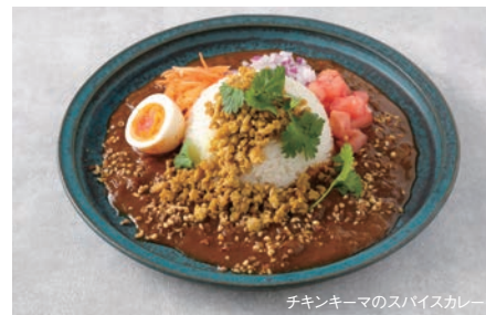
チキンキーマのスパイスカレー