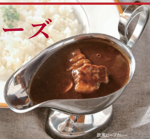
欧風ビーフカレー

スパイスカレー、エスニック、欧風など様々なカレー作りをお手伝いさせていただきます。用途や特長に応じて幅広くご利用いただけます。