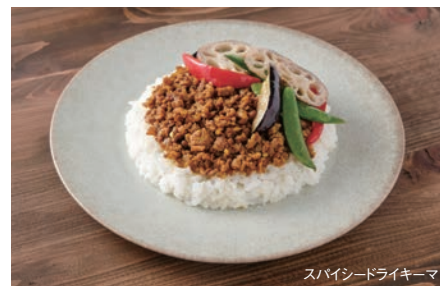
スパインードライキーマ